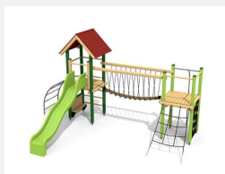
BS.100.L Paysage à grimper 1 - lasure en couleur