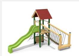
BS.100.1.L Paysage à grimper 1 sur une colline, lasure coul.