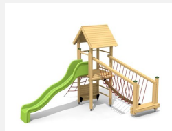
BS.100.1 Paysage à grimper 1 sur une colline