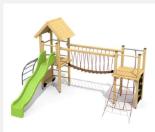
BS.100 Paysage à grimper 1