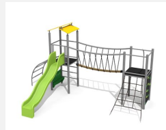
BS.100.M Paysage à grimper 1 steel