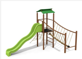
BS.100.1.MC Paysage à grimper 1 sur une colline steel color