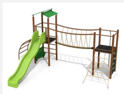
BS.100.MC Paysage à grimper 1 sur métal steel