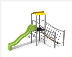
BS.100.1.M Paysage à grimper 1 sur une colline steel