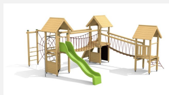
BS.120 Paysage à grimper 3