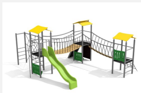
BS.120.M Paysage à grimper 3 steel