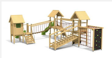
BS.130 Paysage à grimper 4