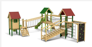
BS.130.L Paysage à grimper 4 - lasure en couleur