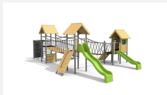
BS.130.HM Paysage à grimper 4 classic steel