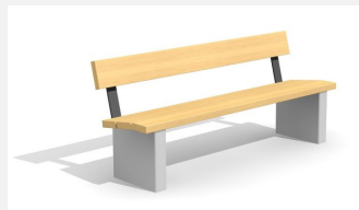
BT.020.B.C Banc Beta - color