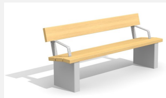
BT.020.BA Banc Beta avec accoudoir