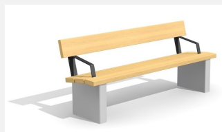
BT.020.BA.C Banc Beta avec accoudoirs - color