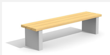
BT.020.H Banc Beta sans dossier