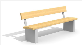
BT.020.B Banc Beta