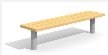
BT.021.H Banc Sola sans dossier