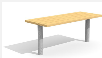
BT.021.T Table Sola