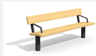
BT.021.BA.C Banc Sola avec accoudoir - color