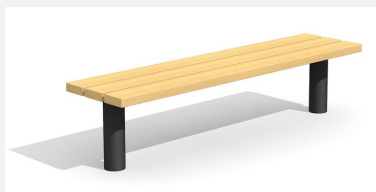
BT.021.H.C Banc Beta sans dossier - color