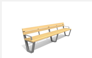
BT.040.BA3 Banc Primo avec accoudoirs 300