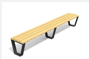
BT.040.H3.C Bans Primo 300 cm sans dossier - color