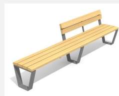
BT.040.HB3 Banc Primo 300 avec dossier partiel