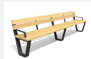
BT.040.BA3.C Banc Primo avec accoudoirs 300 - color