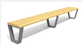
BT.040.H3 Bans Primo 300 cm sans dossier