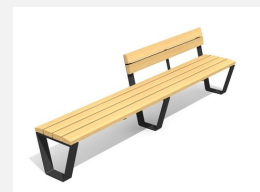
BT.040.HB3.C Banc Primo 300 avec dossier partiel - color