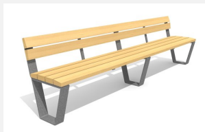
BT.040.B3 Banc Primo 300