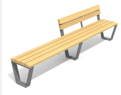
BT.040.HB3 Banc Primo 300 avec dossier partiel