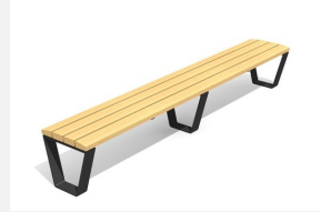
BT.040.H3.C Bans Primo 300 cm sans dossier - color