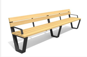
BT.040.BA3.C Banc Primo avec accoudoirs 300 - color