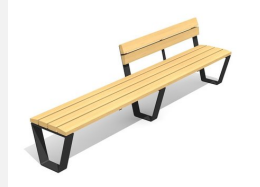
BT.040.HB3.C Banc Primo 300 avec dossier partiel - color