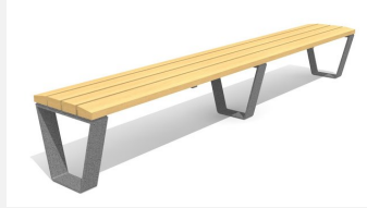
BT.040.H3 Bans Primo 300 cm sans dossier