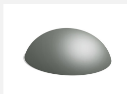
C101.06 La montagne 200 cm