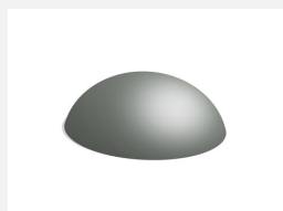
C101.04 La montagne 150 cm, sol amortissant meuble