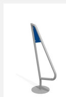
C315.20 Le surfeur mobile