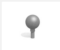
C808.1.3 La boule de saut