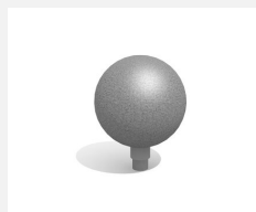
C801.1.1 La grande boule tournante