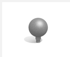
C801.1.3 La petite boule tournante