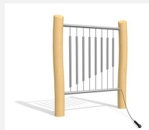
DI.021.1.R Tubes de sonorité - nature