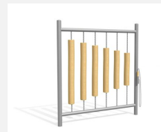
DI.021.3 Bois de sonorité