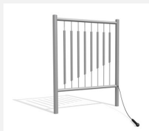
DI.021.1 Tubes de sonorité