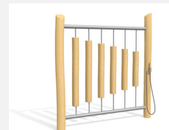
DI.021.3.R Bois de sonorité - nature