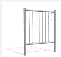
DI.021.2 Barres de sonorité