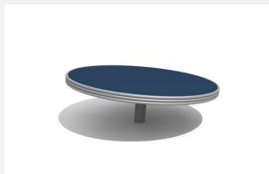
DR.020.20 Plaque tournante Ø 200 cm