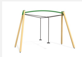
FA.030.C bimbo Balançoire double color