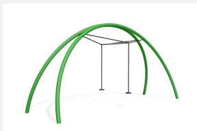
FA.030M.C bimbo Balançoire double Arc en métal color