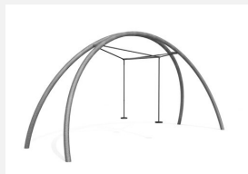
FA.030M bimbo Balançoire double Arc en métal