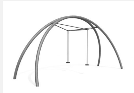
FA.030M bimbo Balançoire double Arc en métal