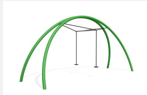
FA.030M.C bimbo Balançoire double Arc en métal color