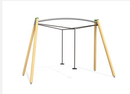
FA.030 bimbo Balançoire double