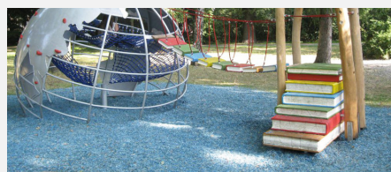
FS.010.2.C öcocolor copeau de bois - en sac en couleur