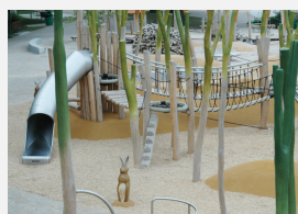
FS.010.2 öcocolor copeaux de bois - en sac