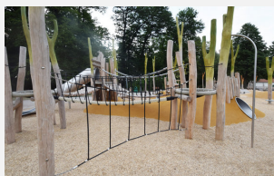
FS.010.3 öcocolor en sac 0.25 m 3