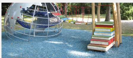
FS.010.1.C öcocolor copeaux de bois en couleur