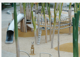
FS.010.2 öcocolor copeaux de bois - en sac