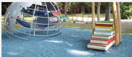
FS.010.1.C öcocolor copeaux de bois en couleur