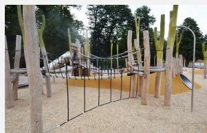
FS.010.3 öcocolor en sac 0.25 m 3