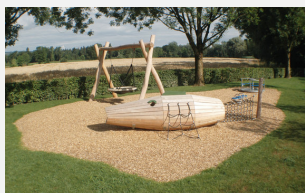
FS.010.1 öcocolor copeaux de bois en vrac