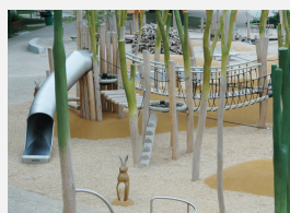
FS.010.2 öcocolor copeaux de bois - en sac