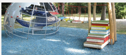
FS.010.1.C öcocolor copeaux de bois en couleur