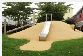
FS.050.30 Granulés en caoutchouc EPDM