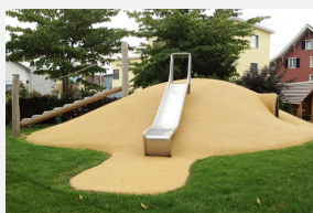
FS.050.15 Granulés en caoutchouc EPDM