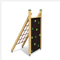
KL.020 Petit combinaison à grimper 1