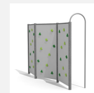
KL.080.3.M Paroi d'escalade 3 en métal