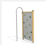
KL.080.1 Paroi d'escalade 1 en bois