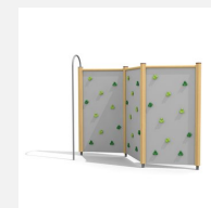
KL.080.3 Paroi d'escalade 3 en bois