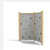
KL.080.2 Paroi d'escalade 2 en bois