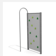
KL.080.1.M Paroi d'escalade 1 en métal