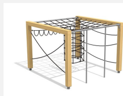
KL.150.1.20 Cube de grimpe en bois 1, hauteur 200 cm