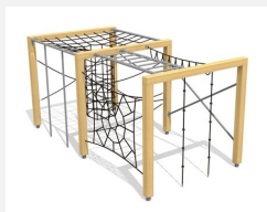
KL.150.2.25 Cube de grimpe en bois 2, hauteur 250 cm