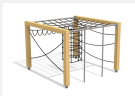
KL.150.1.20 Cube de grimpe en bois 1, hauteur 200 cm