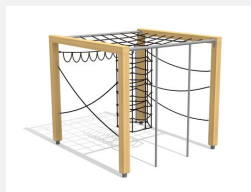
KL.150.1.25 Cube de grimpe en bois 1, hauteur 250 cm