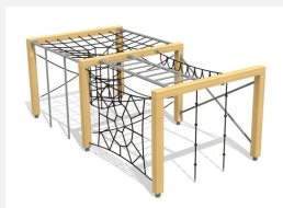
KL.150.2.20 Cube de grimpe en bois 2, hauteur 200 cm