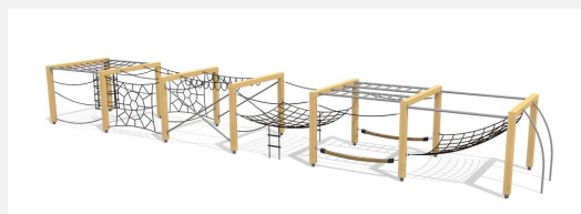
KL.150.6.20 Cube de grimpe en bois 6, hauteur 200 cm