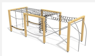
KL.150.4.25 Cube de grimpe en bois 3, hauteur 250 cm