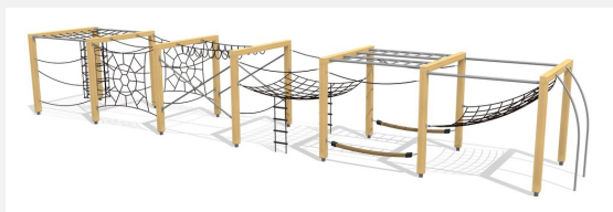
KL.150.6.25 Cube de grimpe en bois 6, hauteur 250 cm