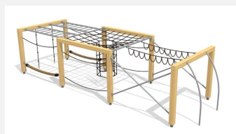
KL.150.4.20 Cube de grimpe en bois 3, hauteur 200 cm