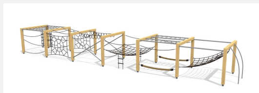
KL.150.6.20 Cube de grimpe en bois 6, hauteur 200 cm