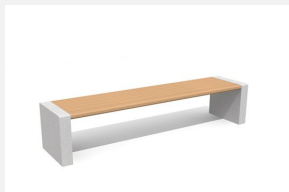
MO.11.02.H Banc Gravi sans dossier en bois dur