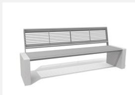
MO.11.00.M Banc Gravi en métal sans accoudoirs