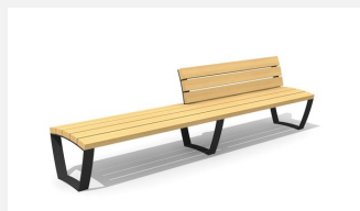
MO.17.22.R Banc 300 cm avec dossier partiel