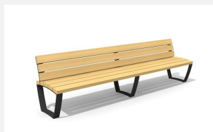
MO.17.23 Banc cado levis avec dossier 300 cm