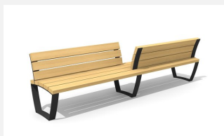
MO.17.24 Banc cado levis avec dossiers partiels