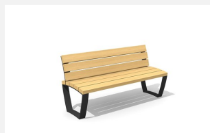
MO.17.26 Banc cado levis avec dossier 155 cm