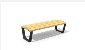
MO.17.25 Banc cado levis sans dossier 155 cm