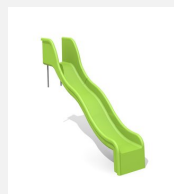
RU.010.15.W Toboggan ondulé de pente