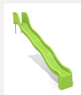
RU.010.20.W Toboggan ondulé de