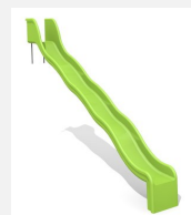
RU.010.25.W Toboggan ondulé de pente