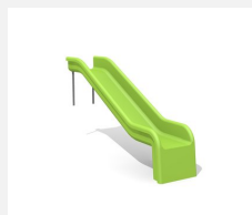
RU.010.10 Toboggan de pente 100 cm