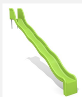
RU.010.25.W Toboggan ondulé de pente