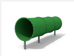
RU.081.10 Tunnel à ramper, libre, droit 320 cm