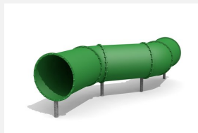
RU.081.30 Tunnel à ramper, libre, s 400 cm