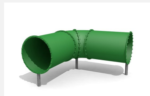
RU.081.20 Tunnel à ramper, libre, angle 90°