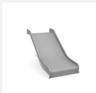
RU.093.10.B bimbo toboggan de pente inox large H