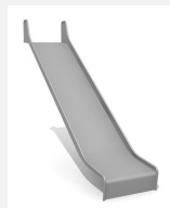
RU.093.25.B bimbo toboggan de