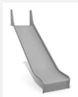
RU.093.20.B bimbo toboggan de