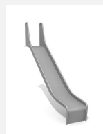
RU.093.15 bimbo toboggan de