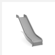
RU.093.10 bimbo toboggan de pente inox H