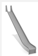
RU.093.25 bimbo toboggan de