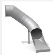
RU.100.20.R Toboggan tunnel droite 90°, 200 cm