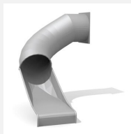
RU.100.15.L Toboggan tunnel à gauche 90°, 150