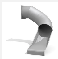
RU.100.15.R Toboggan tunnel droite 90°, 150 cm