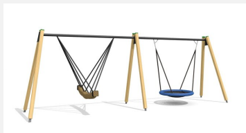
SC.084.40.C Combinaison balançoire viking- nid d'oiseau color