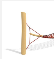
SC.110.98 Suppl. de prix pour limitation