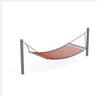
SC.110.1 Hamac XL