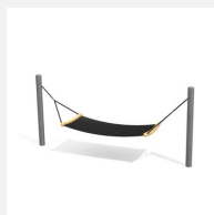
SC.110.3 Hamac confort