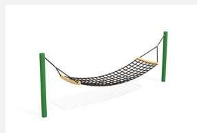
SC.110.C Hamac color