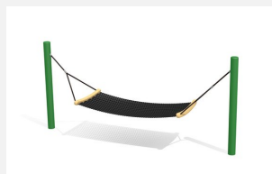
SC.110.3.C Hamac confort color