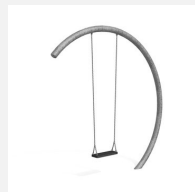
SC.152 Balançoire demi-lune (grande)