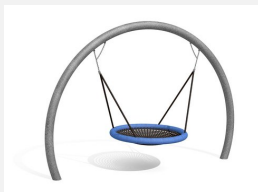
SC.153.3 Le nid d'oiseau lunaire