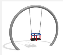
SC.151 Balançoire lunaire (pour les petits)