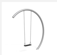
SC.152.I Balançoire demi-lune (grande) inox