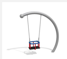
SC.150.I Balançoire demi-lune (pour les petits) inox